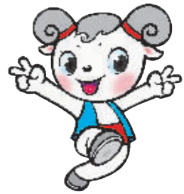
宁夏回族自治区50周年大庆吉祥物“喜洋洋”

2008年9月23日,宁夏回族自治区迎来成立50周年庆典。值此历史性的时刻,宁夏回族自治区向海南致敬!向海南人民致敬! 1958年宁夏回族自治区成立。50年来,海南从人力、财力、物力、智力等方面对