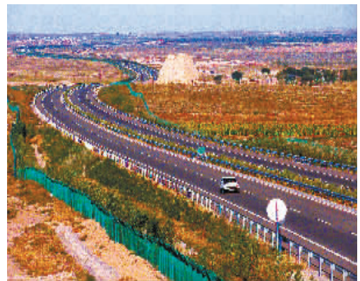
宁夏高速公路已达1000公里。