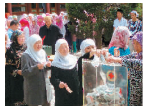
回族妇女为汶川地震灾区捐款。

●宁夏向“世界级贫困”告别。西海固绝对贫困人口数量已由1993年的139.8万人减少到如今的5万人以下;贫困发生率从1994年的15.6%下降到现在的3%以下。