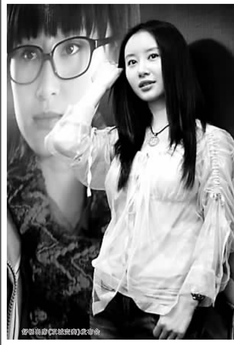
舒畅出席《双城变奏》发布会