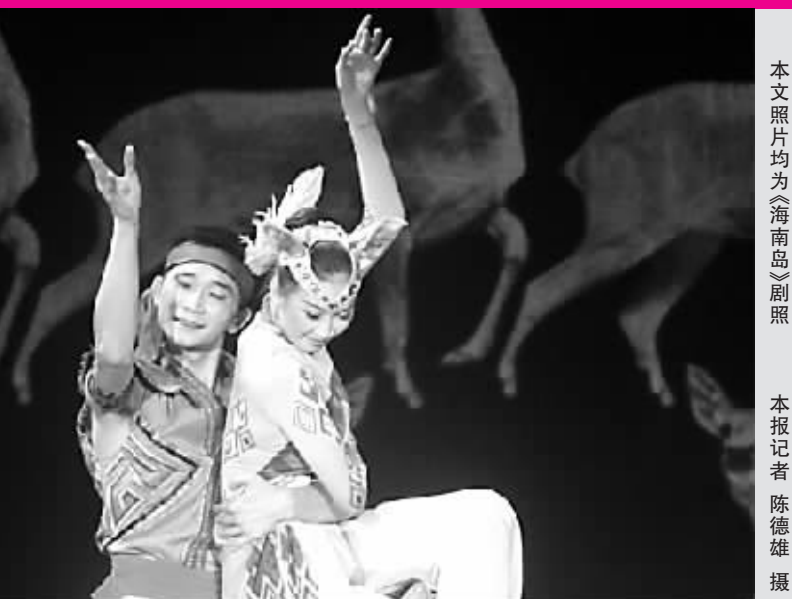
本文照片均为《海南岛》剧照