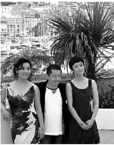
《二十四城记》主创纽约合影