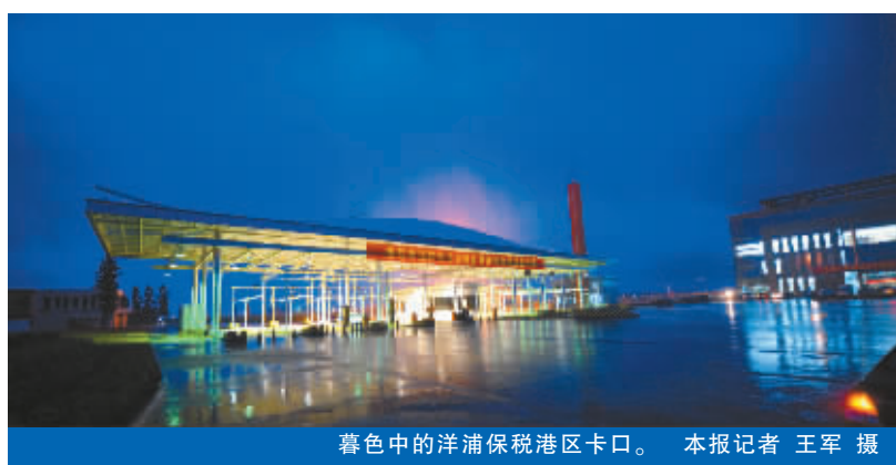
暮色中的洋浦保税港区卡口。