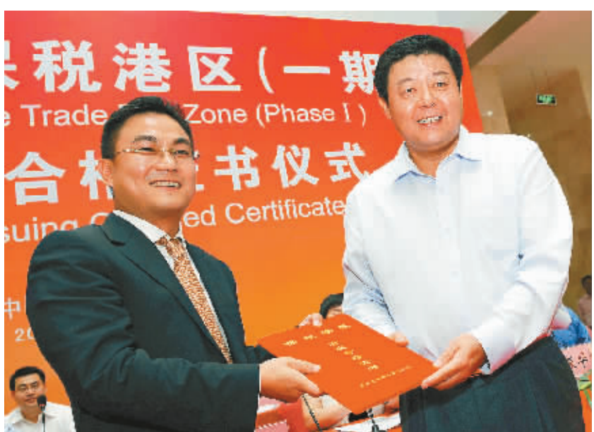
海关总署副署长吕滨(右)向洋浦管理局局长保强(左)颁发《海南洋浦保税港区(一期)验收合格证书》。

他们首先来到保税港区外的综合办公大楼的监控中心机房。在验收机房的同时,他们通过视频查看了区内隔离围网、海关专用巡逻通道、查验作业区、查验库房以及监管仓库等地的情况。3分钟后,当海关总署加工贸易及保税司副司长吕伟红发现查验库房里只有两个监控摄像头时,她再三询问:这么大的库房就两个摄像头能全方位地监控吗?当她了解到,那里的云台监视探头能360度查看所有情况,而她刚才在大屏幕上看到的视频仅是一个摄像头在工