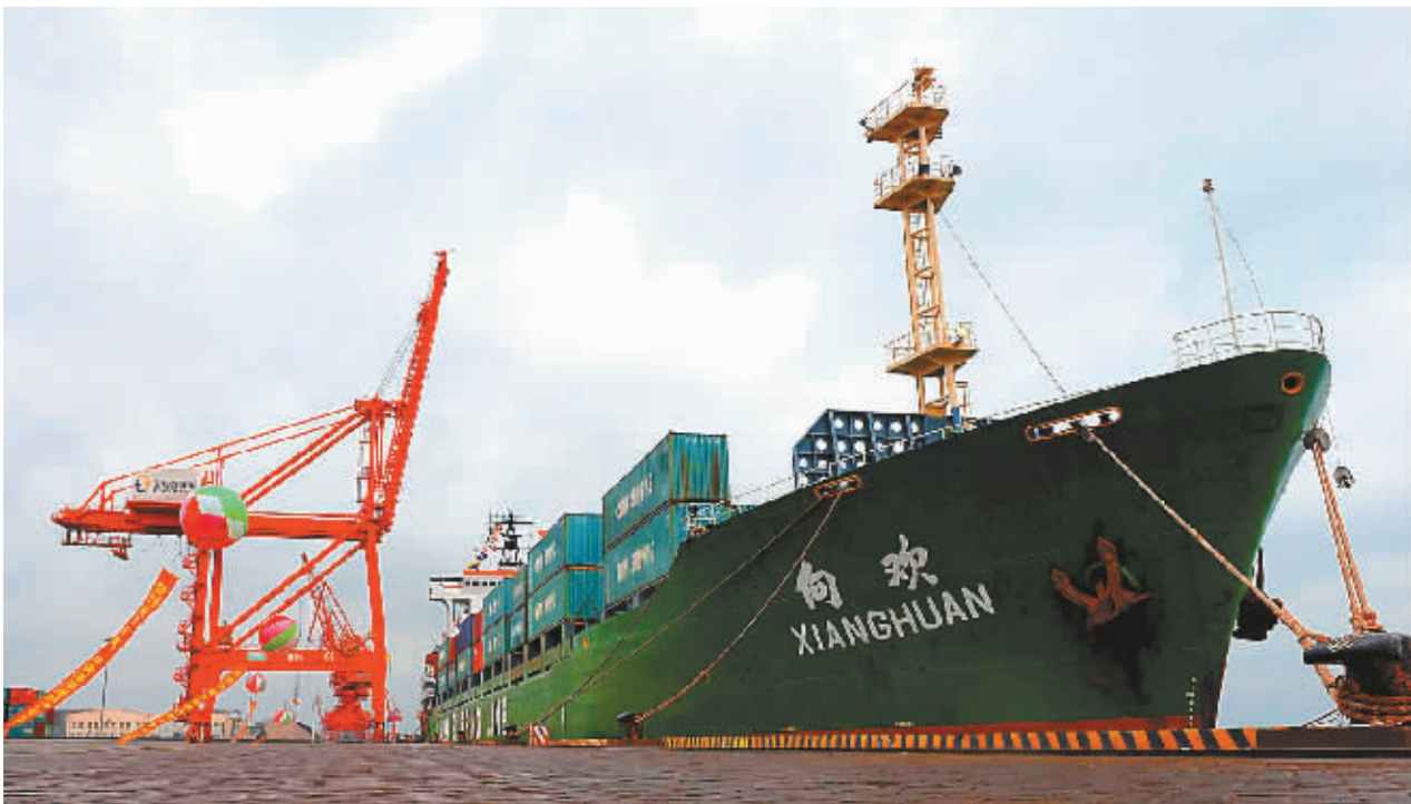
10月13日下午,国投洋浦港码头,“向欢号”即将首航洋浦—华东地区航线。