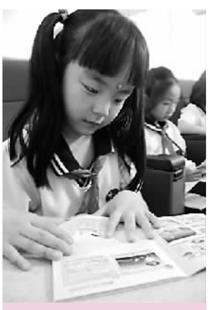
苏州方言的儿歌让当地孩子看得开心。(资料图片)

中国语言资源有声数据库的建设,是在教育部、国家语委指导下进行的。该项工程专家组成员、上海师范大学教授、著名语言学家潘悟云在接受本报记者采访时谈到:“建设语言资源数据库,有助于客观了解我国语言国情。海南是公认语言复杂地区,海南的黎语是中国最古老的语言,海南的军话也极具地方特色,在海南进行方言调查意义重大。”潘教授还透露,在江苏、上海、辽宁、广