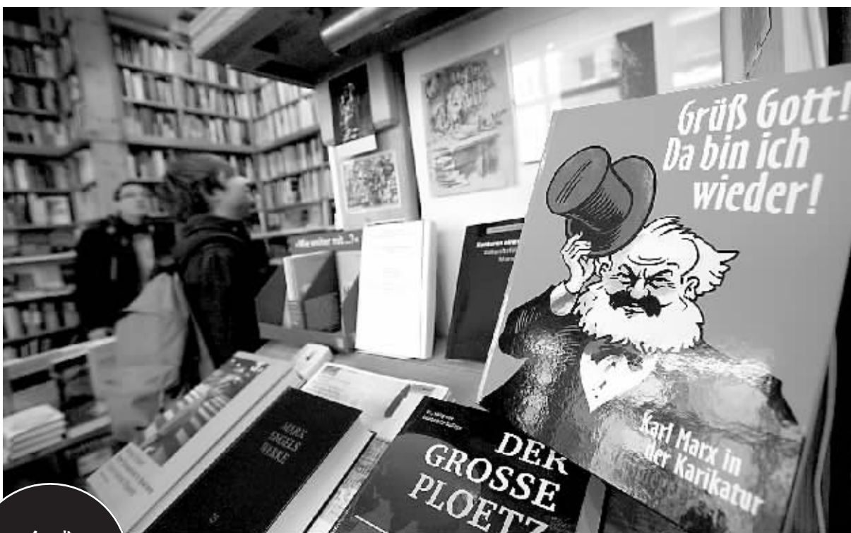
10月17日,两名顾客在德国法兰克福的“卡尔·马克思书店”选购书籍。当天,马克思著作《资本论》第一部在法兰克福的“卡尔·马克思书店”已告售罄。

“我们熟悉的资本主义正在死亡。”德布斯曼在题为《卡尔·马克思和世界金融危机》的专栏文章开头写道,卡尔·马克思对不受约束的资本主义的批判正在得到确证。冯武勇(新华社供本报特稿)