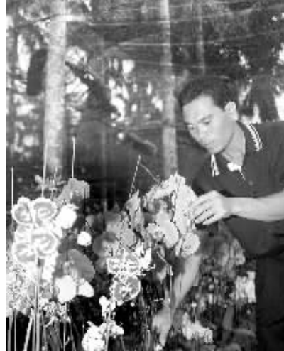
在槟榔树下种兰花,让槟榔村村民尝到了甜头。

本报三亚10月17日电(记者王红卫)记者从三亚市林业局获悉,三亚市政府在投入6305万元于田独镇建设815亩兰花基地的基础上,近日决定再投资588万元,在凤凰镇槟榔河乡村旅游景区扶持64户农民组成兰花专业合作社发展兰花种植,以丰富乡村旅游。