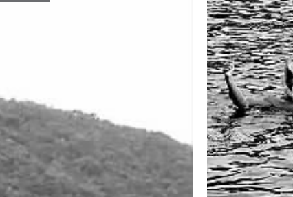
陪游人士“小漆”(图左)陪伴游客在锦母角潜水。