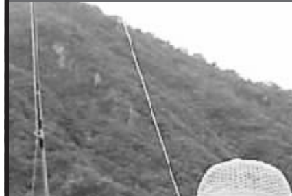
陪游人士“小漆”(图左)陪伴游客在锦母角潜水。

连日来,本报报道的“编外导游”陪游现象受到了社会各界的广泛关注,三亚市旅游产业发展局负责人今日表示,政府职能要延伸到新兴行业,相关行业也要加强行业自律和自我管理。