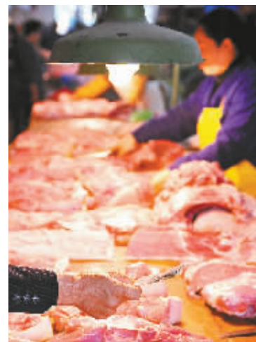
10月20日,消费者在银川市一家菜市场购买猪肉。新华社发

对于CPI、PPI的回落,谭雅玲认为,虽然有所回落,但是不能放松调控,更没有理由来判断当前的政策有从紧的嫌疑。中国经济的“一保一控”(保经济控通胀)的“控”绝对不能放松。(网易财经)