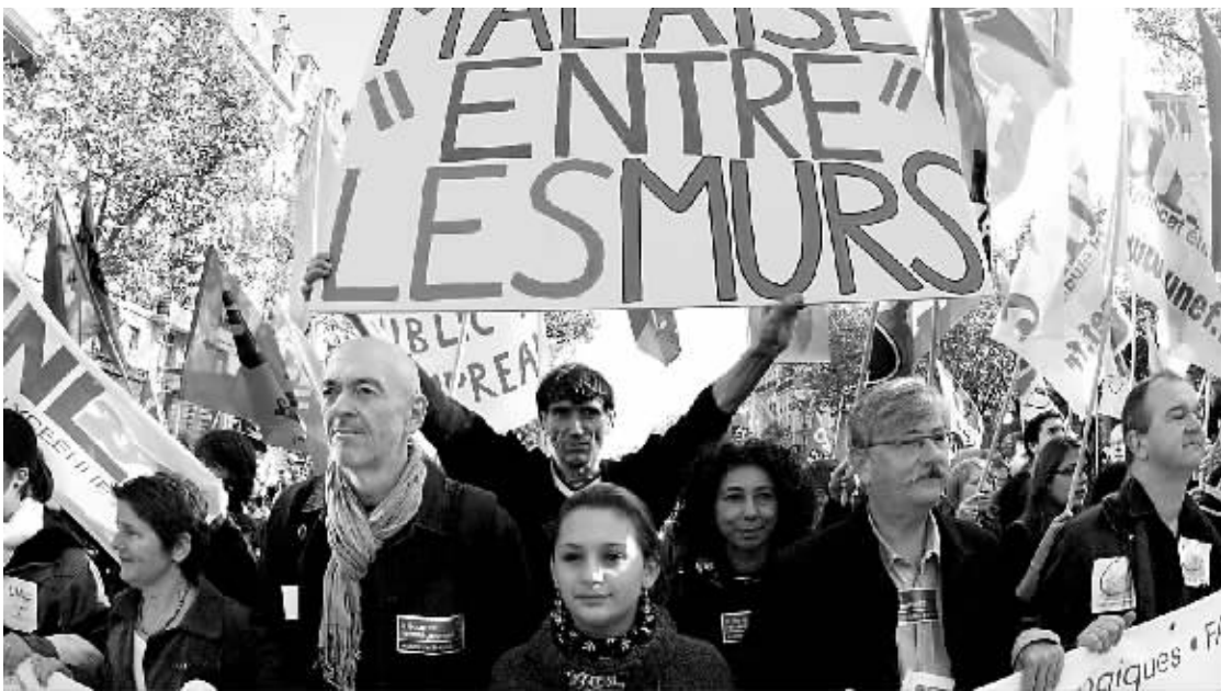
图为走上巴黎街头参加游行的人群。

法国小学教师的最大工会号召下个月举行全国大罢工,预计各教育系统工会在本月22日举行的一次会议上将讨论这一计划。