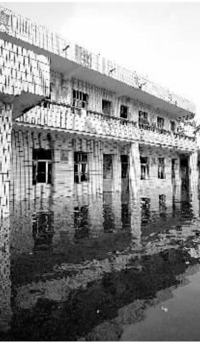
10月20日,龙洪小学的教学楼还泡在水里。

仍在洪水围困与浸泡中的海口龙华区龙桥镇龙洪村委会,今天显得格外热闹与喜庆,因为帐篷小学开课了,村里的孩子们又能上学了!