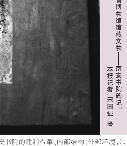
省博物馆馆藏文物——南安书院碑记。