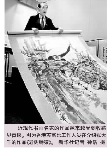
近现代书画家们的作品越来越受到收藏界青睐。图为香港苏富比工作人员在介绍张大千的作品《老树猿猴》。