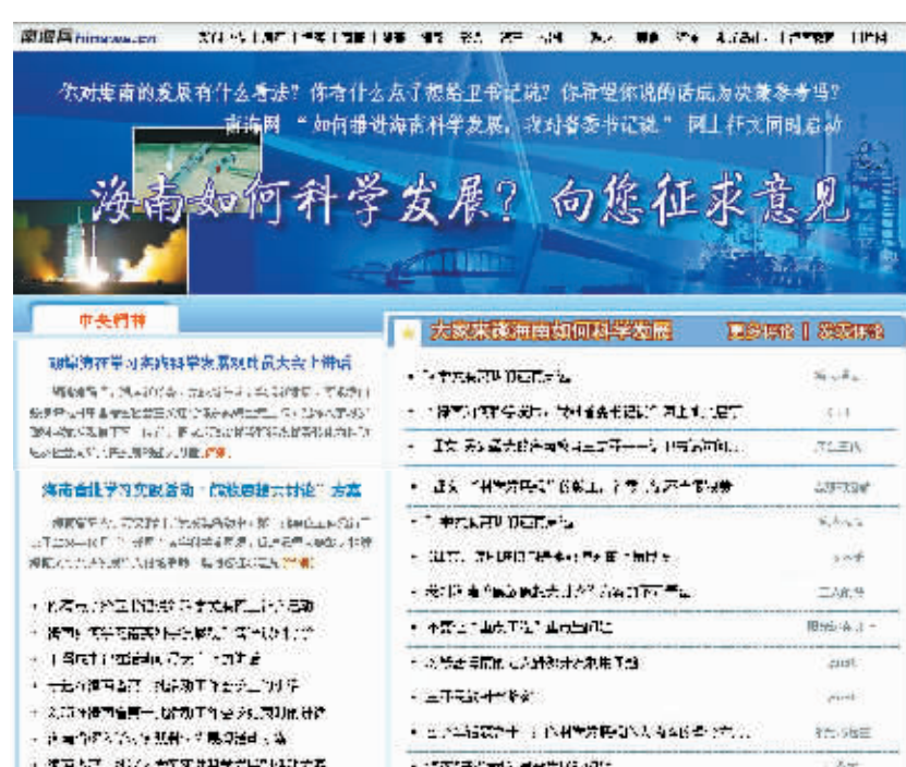
南海网开设的“深入学习实践科学发展观”专栏网页