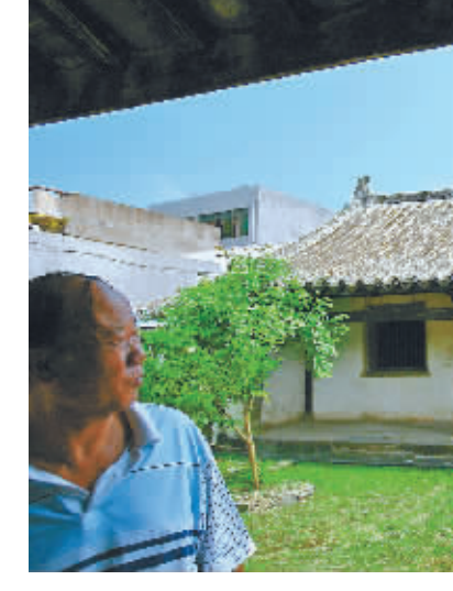
丘濬故居。

的墙体以及鼓楼上破旧的房子，已很难想象这里曾经是多少海南本地文人墨客登高望远，吟诗作对的首选之地。零碎的记录、地方志里的记载还能拼凑出城墙的大体轮廓，折射着府城曾经有过的繁华和荣耀，但城墙之内曾上演过的无数次时代变迁的血雨腥风，无数平民百姓的恩怨情仇，大多已被淹没于历史的尘埃之中。