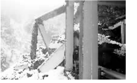
然乌沟防雪走廊被暴风雪摧毁。

据新华社拉萨10月28日电(叶祥、杨超)26日至28日,西藏山南地区错那县遭遇暴风雪袭击,9名农牧民群众被困。27日17时左右,军分区某边防团接到错那县政府的救援请求,请驻军救援被困在距离县城17公里外的坡山口上的9名群众。10名解放军官兵出动两台推土机开路,30多名地方人员跟随其后,冒着零下30多摄氏度的低温,推雪前往坡山口营救,直至23时40分才推进了5公里左右,此时雪越下越大,积雪厚度已达1.5米,为避免救援人员伤亡,他们只好返回营区。 据新华社西藏林芝10月28日电(叶祥、张中百)27日中断的川藏公路再受重创。28日上午10时左右,川藏公路然乌沟段因受27日夜暴雪影响再次发生雪崩,并引发山体垮塌。目前,尚无人员伤亡报告。