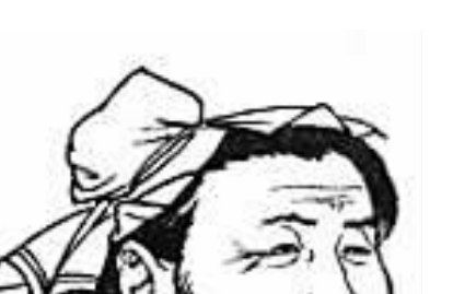
黄道婆画像

“来自”之意,因此陶文和王文的记述是一致的,都是真实可靠的,跟孰前孰后没有关系。