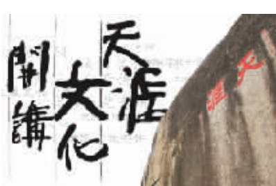
崖州来了个黄道婆

三亚的目标是建设一个真正意义上的国际性热带滨海旅游城市,在向这个目标冲刺时,靓外是不可少的,修内更是必需的。