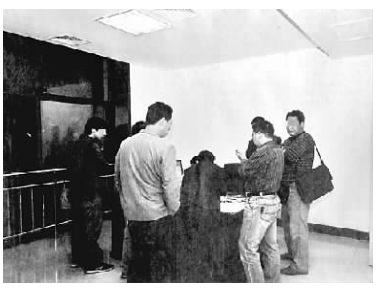
9月25日晚,山西霍宝干河煤矿,真假记者排队领“封口费”。

新闻背景:山西省洪洞县霍宝干河煤矿发生一起安全生产事故,煤矿未向上级报告,反而为闻风而来的“记者”们发放“封口费”,多则上万元,少则几千元。煤矿方面称,领取“封口费”的记者有四五十人,而《西部时报》一位拒领的记者说,据他目测有上百人。而且“封口费”的发放持续了数日。记者调查发现,不少假记者也混迹其中。据悉,中央有关部门调查组已经抵达山西调查“封口费”之事。(10月27日《中国青年报》)