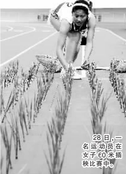
28日,一名运动员在女子60米插秧比赛中。