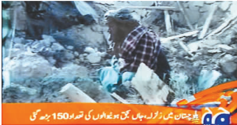
10月29日的电视截图显示,在巴基斯坦俾路支省的济亚拉特,一名男子坐在被地震毁坏的房屋废墟上。

巴政府已组织救援人员向受灾地区紧急运送了1000顶帐篷、1500条毛毯以及食品等物资。