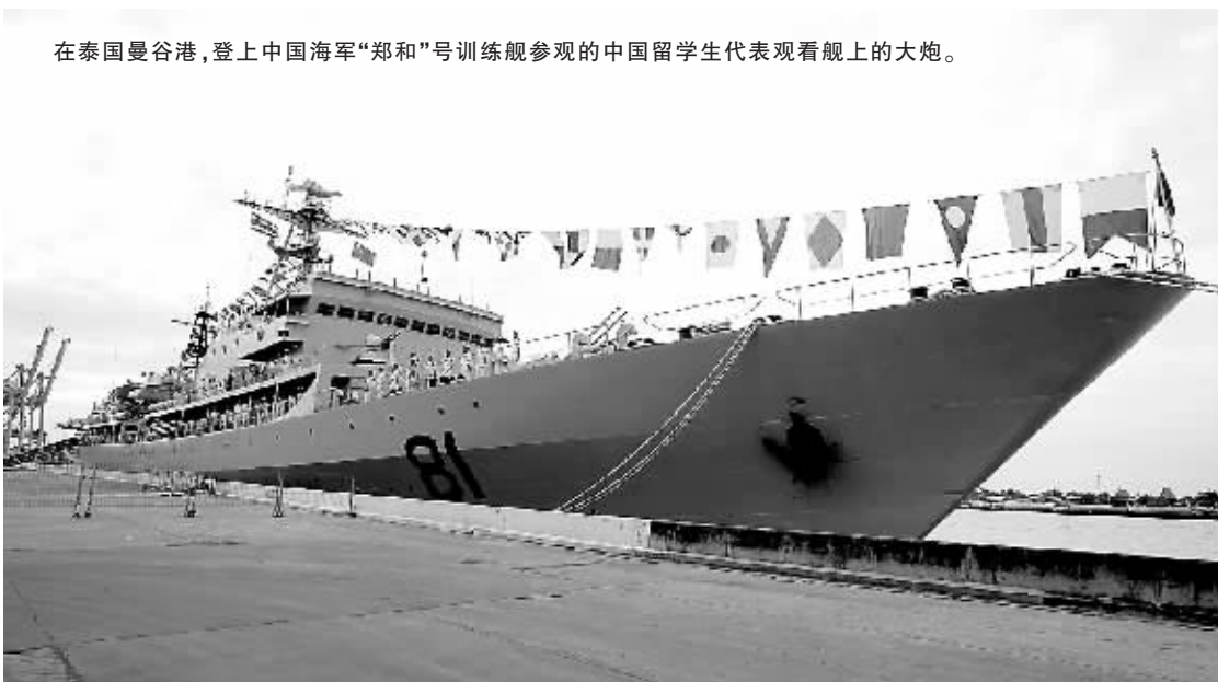
在泰国曼谷港,登上中国海军“郑和”号训练舰参观的中国留学生代表观看舰上的大炮。