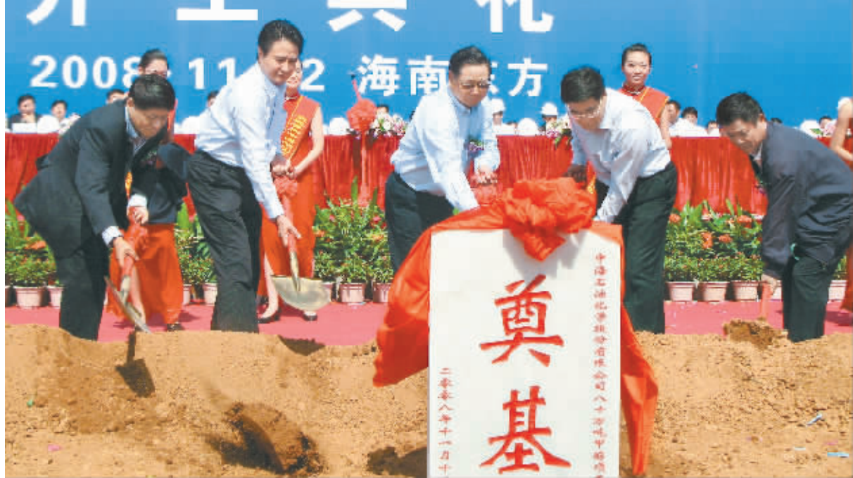
卫留成、罗保铭等为八十万吨甲醇项目奠基。

由于乐东气田天然气存在高氮、高二氧化碳、低热值的气质特点,项目采用了目前世界上最先进的甲醇制造工艺,具有能耗低、流程短、设备少、占地面积小、经济附加值高等特点。项目设计能力日产甲醇 2500 吨,每吨甲醇总能耗远低于国内中型甲醇装置的能耗指标,其综合能耗能达到目前国际大型甲醇装置的先进水平,产品质量标准能达到美联邦“AA”级标准。 据介绍,项目最大的亮点在于能合理利用乐东气田天然气二氧化碳含量高的特点,在生产甲醇的过程中能有效解决合成气中氢多碳少的矛盾。这样,既能节省天然气的消耗,还能大大减少二氧化碳的排放量,经计算每年消耗二氧化碳 25 万多吨。因此,生产甲醇被确定为乐东天然气的最佳利用方案,其环保效益远远高于发电用及民用。 罗保铭在致辞中首先对中海油多年来给予海南的支持和帮助表示感谢。他指出,今天开工的这个项目,将强有力地拉动我省经济增长,增强我省经济发展后劲。 罗保铭强调指出,受愈演愈烈的国际