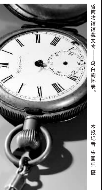
省博物馆馆藏文物——冯白驹怀表。

本报讯 (记者梁昆)汇集海南资深摄影记者武进群印度之行的摄影作品集《十日印象》,近日已由中国图书出版社出版发行。作品共收入武进群于今年三月在印度采风时的精彩力作100多幅,涉及印度风光、百姓生活、都市及乡村风貌等方面。