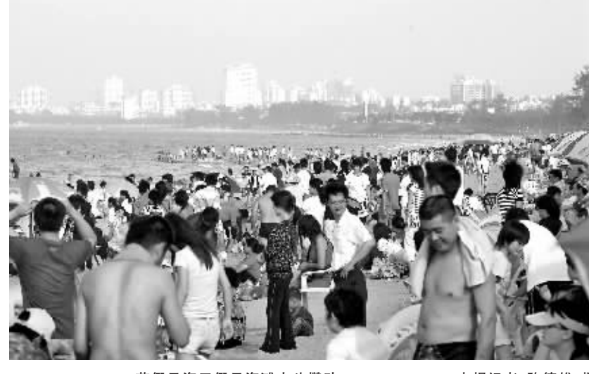
节假日海口假日海滩人头攒动。本报记者 陈德雄 摄

这一简单、好记而且又略带点生活时尚意味的名字,很快得到了当时海口市委、市政府的认可。在一个隆重的仪式之后,全长7公里、东起秀英海滨游泳场、西至五源河出海口的这一段海滩,被正式命名为“假日海滩”。