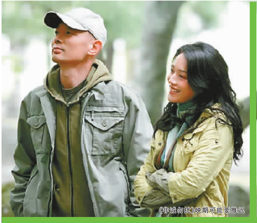
《非诚勿扰》映期可能要推迟

业内人士透露，“贺岁档一向是全年市场容量最大、市场周期最长、票房产值最高的一个档期。而档期是与票房息息相关的，这也是为什么今年的贺岁档频频出现调整影片档期的状况，大家都在寻求一个最合