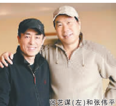
张艺谋(左)和张伟平

在招标会上,《茶馆》主演陈宝国讲述为该剧剃眉毛的辛酸故事打动了很多人,也让外界普遍认为开年大戏锁定了《茶馆》。