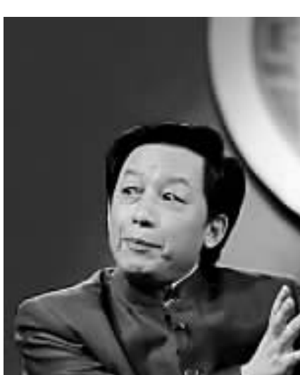
易中天与《百家讲坛》(资料图片)

《百家讲坛》进入“死亡倒计时”,这个观点是否激愤暂不作评价,《百家讲坛》前景暗淡,当是不争的事实,没人愿意看到一档曾经红红火火的电视栏目,其“花季”如此短暂,好像法布尔笔下的蝉那样,刚才还在引吭高歌,很快就已经落入坟墓。相信央视不会坐视《百家讲坛》危在旦夕,会竭力予以“抢救”。《百家讲坛》会不会死亡,我们不是算命先生,不敢为之占卜。可以肯定的是,动了手术保住性命”的《百家讲坛》,能否复活昔日的青春风采,显然是个很大的未知数。 电视媒体有其特殊的传播规律。譬如,电视媒体不适于传播抽象的学术理论,哪怕是请大师授课,依然难以改变这个规律。当年,法国的电视媒体曾多次邀请具有国际学术声誉的思想家皮埃尔·布尔迪厄在电视上讲课。布尔迪厄先生几次拒绝,最后在电视《百家讲坛》危在旦夕,会竭力予以“抢救”。《百家讲坛》会不会死亡,我们不是算命先生,不敢为之占卜。可以肯定的是,动了手术保住性命”的《百家讲坛》,能否复活昔日的青春风采,显然是个很大的未知数。