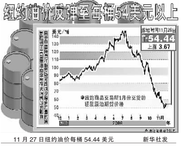
11月27日纽约油价每桶54.44美元

新方案规定,当国际原油价格低于80美元/桶,国内成品油价格与国际同步调整;当国际原油价格高于80美元/桶时,扣减加工利润率计算国内成品油调价;当国际原油价格高于130美元/桶时,国内成品油价格另行确定。