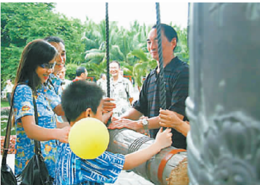
2007年11月,“愤怒的老驴”一家受邀重游三亚。

此事引起了省委常委、三亚市委书记汪洋的高度重视。三亚市委、市政府在第一时间做出反应,在调查该事件的同时,一场前所