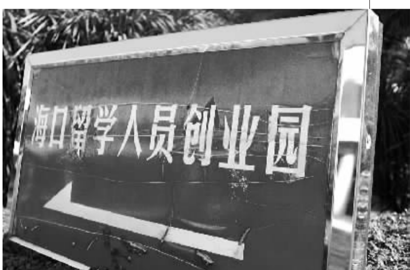
↑如今海口保税区内的海口留学人员创业园,显得有些萧条。

有关人士建议,设立留学人员来琼创业扶持基金是一条解决出路,这个话题已经多次提出,但一直没有实质进展。同时,还应该创造条件组织留学人员与企业合作,承担企业的重大科研任务,以满足科研工作的经费需要,实现成果产业化。