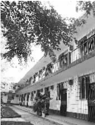
↑海口留学人员创业园一些项目孵化出壳后,正虚位以待。

如果海外留学归国人员想来海南注册科技型企业进行创业,那么海口国家高新区留学人员创业园将是首选。如今,这里有 16 家入园企业,有些科研成果被列为省级重点科技项目,有些成果已进入产业化生产阶段。