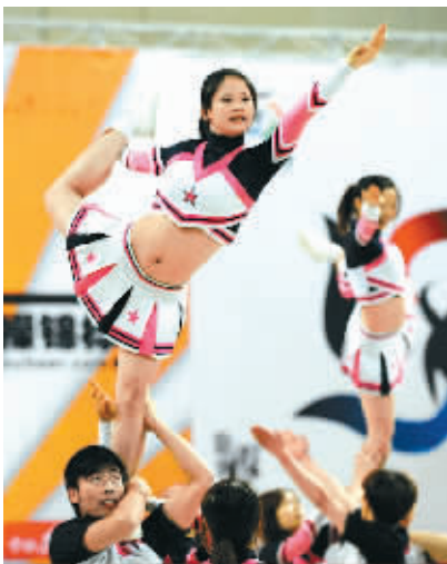
12月9日，2008年全国技巧暨首届拉拉操锦标赛在江苏省江阴市开赛。图为武汉大学代表队在比赛中表演。

李昌镐幽默地说：“今天的运气很好，经过一番苦战取得了胜利。可能因为我是场上唯一一名外国棋手，对手古力对我作了让步，所以我赢了。”