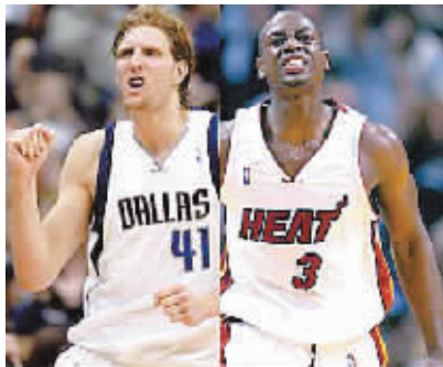
韦德（右）和诺维茨基在比赛中。