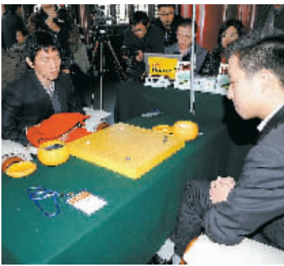
李昌镐（左）和古力在比赛中。