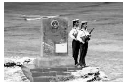
西沙哨兵

在众多歌唱海南的歌曲中，《西沙，我可爱的家乡》以其优美动听的旋律和浓郁的民族风格独树一帜，传唱30多年经久不衰，每次听到这首歌的时候，我都充满了作为一个海南人、一个中国人的自豪感。