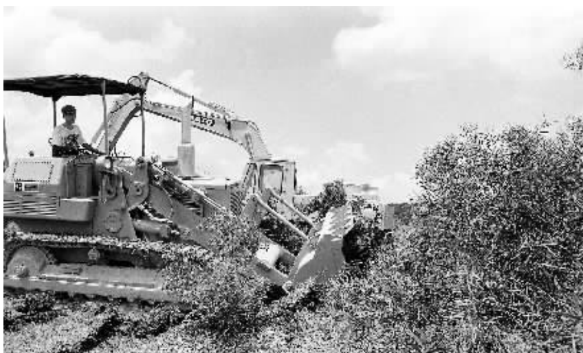
1992年6月26日，洋浦土地“三通一平”开工。

时任海南省委书记的许士杰更是诗兴大发，满怀激情写下“豪情华发当年，又种神州实验田”的诗句。但随之而来的变故，使这一“开放壮