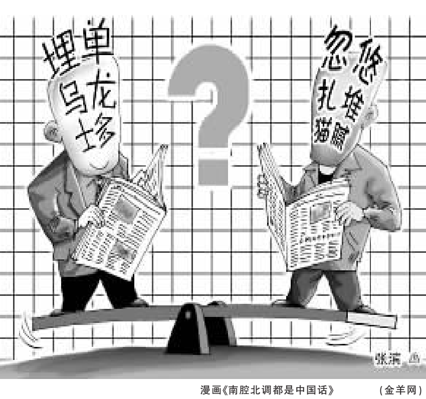
漫画《南腔北调都是中国话》 (金羊网)

下老家的方言,但是没有那个环境,真的说不出来。不过我现在还是过得很好,很正常啊!如果我的家乡方言终有一天走向了消亡,我也许也会感到遗憾,但是如果是社会发展必然结果,也应该能接受,就好像人有生老病死一样。