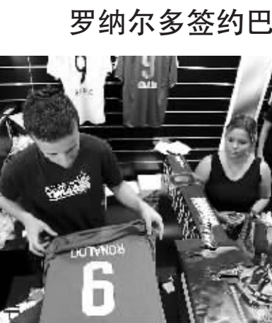
12月10日,在巴西圣保罗,球迷(左二)在购买印有罗纳尔多名字的科林蒂安斯队队服。