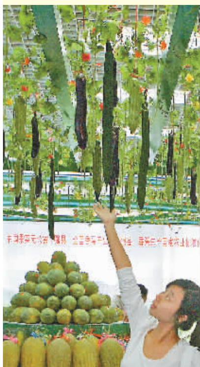
好长 架子上挂满长长的丝瓜。