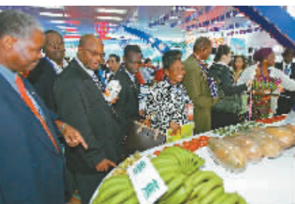
好看 外宾参观展馆。