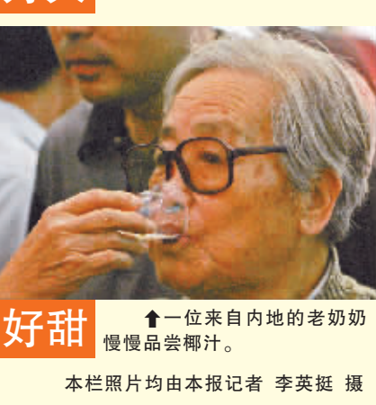
好甜 一位来自内地的老奶奶慢慢品尝椰汁。