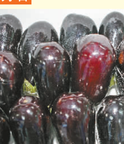
好大 海口展馆首次展出太空茄。