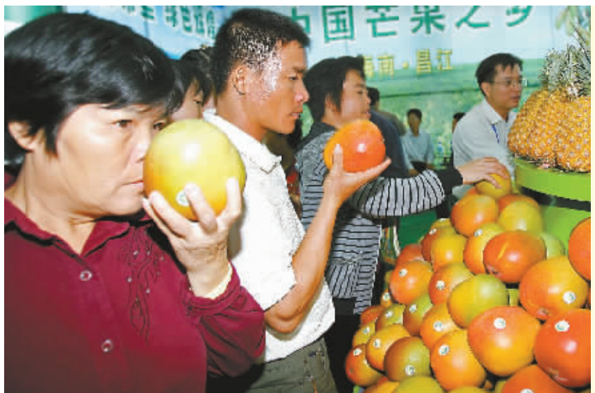
好香 昌江展馆的澳芒香味四溢。

天”为主题,色彩斑斓的“海底世界”尽收眼底。今年共有海南果蔬食品配送有限公司、儋州珠联冷冻有限公司等12家知名水产品企业参展。海洋馆今年展出的产品有优质活品、加工品、冰鲜、海洋生物制品、干品等五大类。