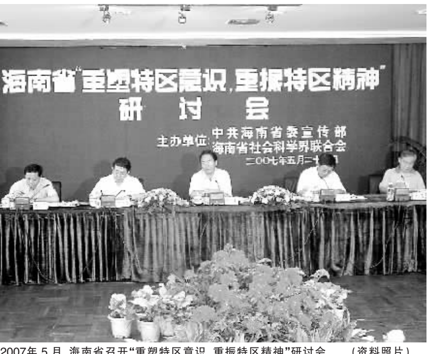
2007年5月,海南省召开“重塑特区意识,重振特区精神”研讨会 (资料照片)

涵作出理论上的阐述。周文彰同时认为,建省意识,在个人地位问题上,是一种官本位意识;在日常工作上,是一种常规省意识。在建省意识的支配下,部分干部较多地关心个人的地位升迁,较少地关心特区的前途命运;过多的是考虑海南是一个省,过少地想到海南是一个特区,每每以常规省为参照和范本来对待和处理特区事务,以传统思想观念和方法来考虑特区问题,缺乏