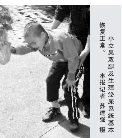
小立果双腿及生殖泌尿系统基本恢复正常