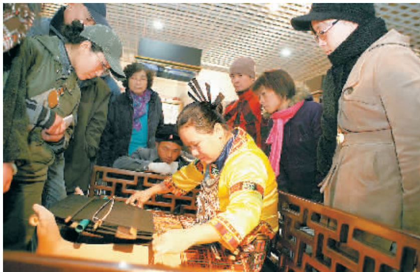
黎族传统纺染织绣技艺现场表演，让观众如同时身临黎寨，感悟黎族文化魅力。