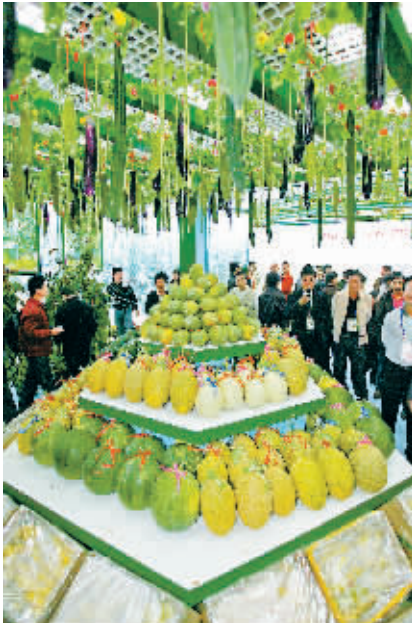
12月13日，海交会展馆内交易活跃，人气旺盛。

农产品加工招商引资也是交易会的重头戏。今天，琼中、昌江、定安、屯昌四个市县在农产品加工园区招商推介会上，共有13个项目签约，金额达23亿元，其中超过亿元的项目有8个，分别是海南九江投资有限公司的加工、冷库、物流项目，金额为9.6亿元；海南和欣天然橡胶产业有限公司的环保型橡胶加工厂项目金额为2.5亿元；海南南国食品有限公司的热带果蔬加工项目，金额为2亿元；海南正农酒精厂的燃料乙醇项目，金额为1.75亿元；海南诺泰生物制药有限公司的多肽类药品项目，金额1.5亿元；欣达国际控股集团水产加工项目，金额1.5亿元；定安合利包装印刷公司包装箱等项目，金额为1.2亿元；海南农产品运销有限公司的槟榔加工等项目，金额为1.1亿元。