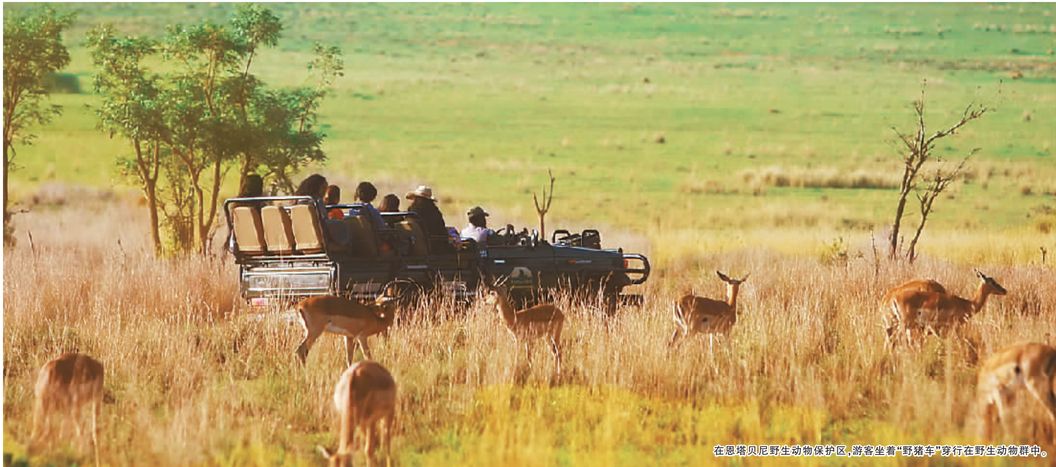
在恩塔贝尼野生动物保护区,游客坐着“野猪车”穿行在野生动物群中。