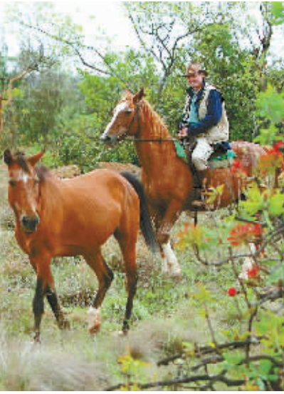
恩塔贝尼野生动物保护区里骑马的游客。