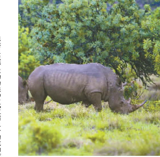
恩塔贝尼野生动物保护区,五霸之一的犀牛。