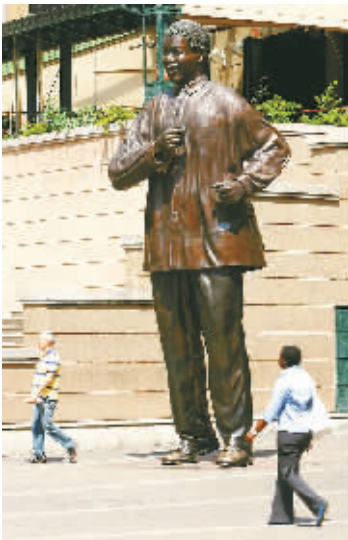
约翰内斯堡的曼德拉广场。