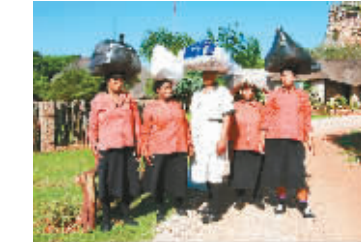
恩塔贝尼野生动物保护区，头顶物品出行的服务员。

球手发球之后，再次乘坐红色直升飞机，在峡谷峭壁之间穿行，尽情享受短暂但丰富刺激的天上之旅后，下到果岭，然后再慢慢推杆。那感觉，想必是对高尔夫毫无兴趣的人，都想过来推那么一杆！