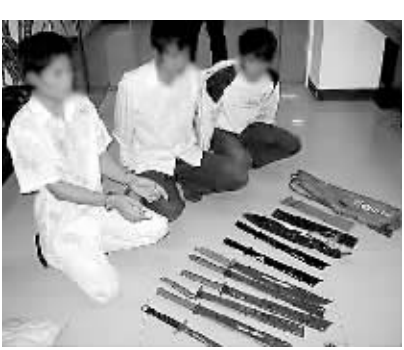
海口警方抓获抢劫嫌疑犯

招数四 发动群众 广大群众既是街面犯罪的受害者,也是公安机关围剿街面犯罪的耳目和眼睛。海口市龙华分局制作了200多条宣传标语,张贴在辖区内大街小巷及娱乐场所、酒店业等重点治安部位。自实行举报措施以来,收到热心市民举报的违法犯罪线索80多条,抓获各类违法犯罪嫌疑人17人。