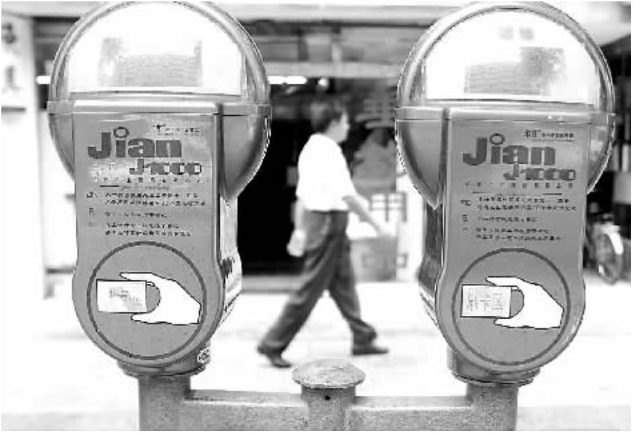
2005年9月以前海口街头使用的泊车咪表,后被手机缴费模式替代。

陈金玉老大娘是保亭县加茂镇北赖村人。1940年春,日军侵占保亭并在加茂河边建立据点。1941年初,陈金玉被日军征到据点强迫充当慰安妇,天天遭受日本军人的强暴与凌辱,过着非人痛楚的生活。日军投降后,她嫁给了当地的一位农民,由于当时有幸不吃日军发的“预防丸”,先后生了3男2女。