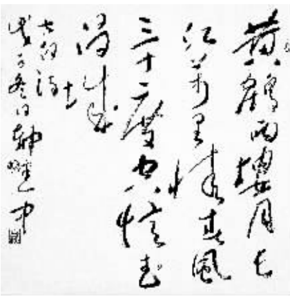
李白诗《送储邕之武昌》 郝建中书