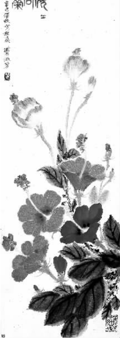
国画:《欣欣向荣》 萧淑芳作