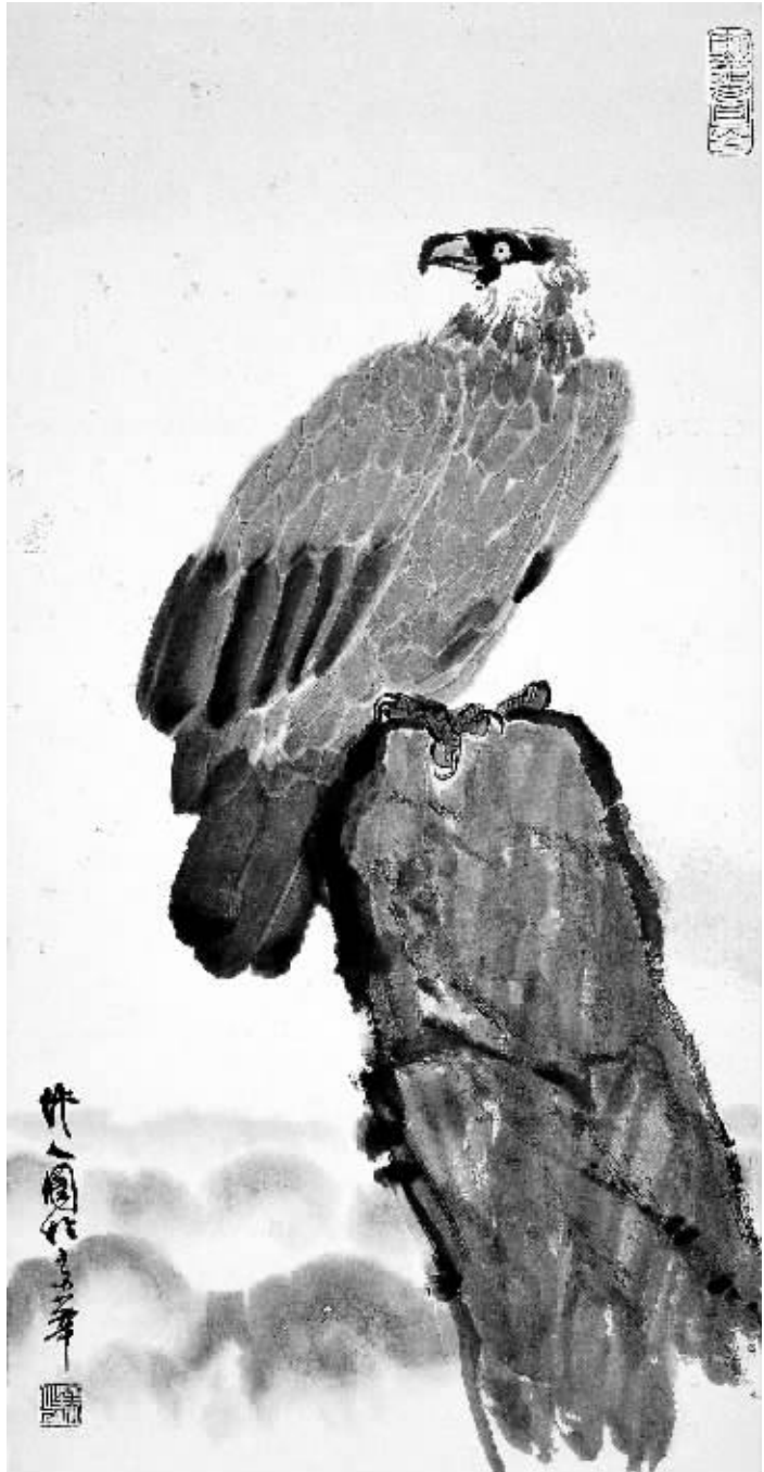
国画:《苍鹰》 吴作人作

时王家美术学院学西画,回国后任教南京中央大学艺术系,新中国成立后虽已年近花甲却自觉地深入到群众、大自然中去观察、体验;他的足迹遍布大半个中国。作为中国美术最高领导机构——中国美术家协会主席兼中央美院院长,吴作人自改革开放以来更是意气风发,奋勇地挑起了复兴中国绘画艺术大业的重担。