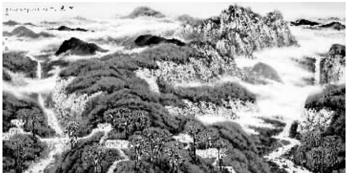
国画:《林岚秋色》 张仁芝作

马先生认为,人物画与山水、花鸟画不同,人是有思想、有感情、有神采、有性格、有精神和灵魂的,因而画人物,首先要传神,要写