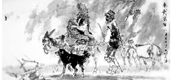
国画:《春到昆仑》 马振声作

口,现定居于北京香堂社区。现为中美美术家协会会员、中央文化艺术研究院副院长、北京湖社画会副会长。