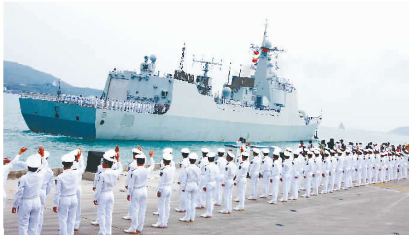
战友,一路走好。

龙卷:护航任务时间长,人员容易疲劳从而会影响战斗力。亚丁湾、索马里海域高温、高盐、高湿,对装备的持续运行也是一个考验。