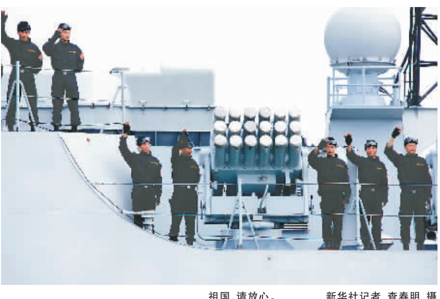
祖国,请放心。

据新华社海南三亚12月26日电(记者白瑞雪 朱鸿亮)随着中国海军护航编队26日起航赴亚丁湾、索马里海域执行护航任务,中国在维护国家利益与世界和平的道路上迈出了重要一步。