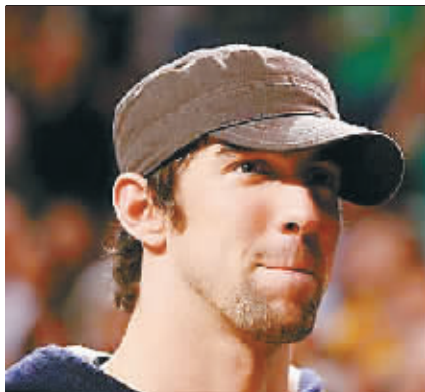
奥运会后菲尔普斯曝光率极高。

备受国人期待的刘翔在8月18日进行的奥运会110米栏预赛中国因伤退赛，中国飞人以这样一个伤感且无奈的方式结束了北京奥运会的征程，也提前结束了本赛季的赛程。另一端，刘翔这两年最大的竞争对手罗伯斯则演绎了一个几乎完美的赛季，6月12日在捷克布拉迪斯拉发举行的国际田联大奖赛上，罗伯斯跑出12秒87的成绩，以0.01秒的优势打破了刘翔的世界纪录。