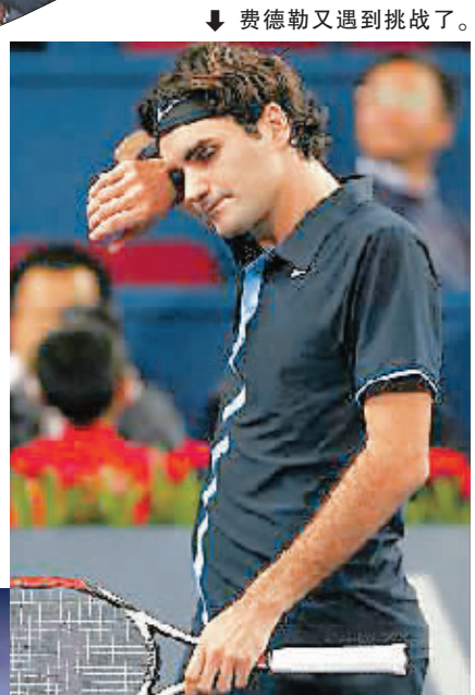
费德勒又遇到挑战了。

“费纳争霸”是男子网坛近几年的主题。虽然从双方直接交手纪录上看，纳达尔占据明显优势，但从奖杯数量及世界排名上看，费德勒前几年一直压着纳达尔，自己创下连续排名世界第一时间纪录的同时，让纳达尔成为史上在位时间最长的世界第二。2008年，前几年的“千年老二”纳达尔终于翻身，在连夺背靠背的法网、温网以及奥运金牌，并借此篡夺世界第一王座成功之后，2008赛季几乎被打上了“纳达尔年”的标签。不过，纳达尔很快发现世界第一的宝座很烫屁股，一方面，他得时刻提防费德勒卷土重来，另一方面，小德、穆雷等也对他的宝座虎视眈眈。明年的网坛属于谁？还真难说。