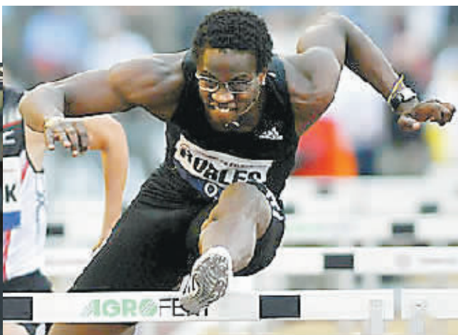
发比赛中，马当先破世界纪录。