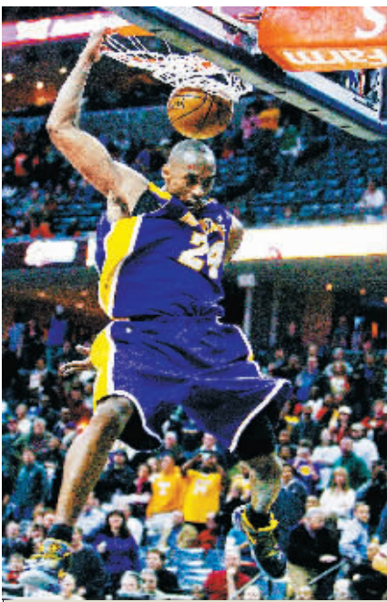
科比的扣篮比詹姆斯飘逸。