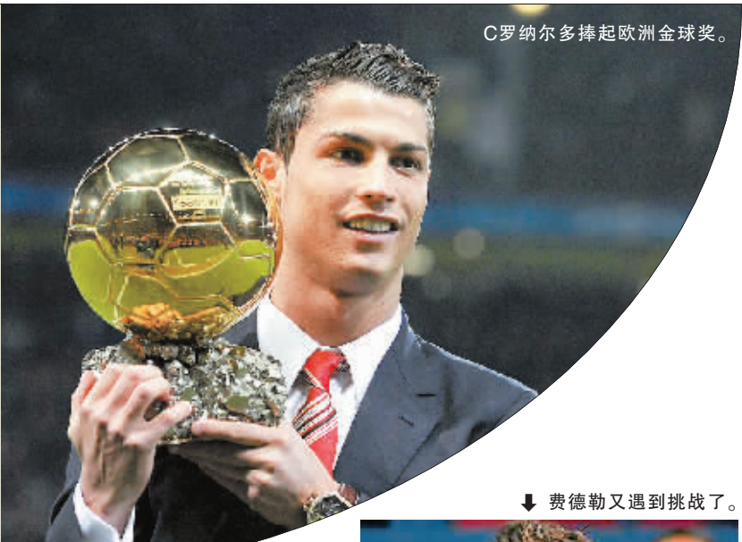
C罗纳尔多捧起欧洲金球奖。

效力曼联的葡萄牙球星C罗纳尔多无疑是2008年足坛最风光的球星，在这一年，他登上了职业生涯的巅峰，他几乎包揽了已经评出的包括欧洲金球奖在内的所有个人最佳奖项，世界足球先生的名号看来也指日可待。但C罗并非没有对手，在各项评选中，巴塞罗那的阿根廷球星梅西都成为他的最大竞争对手。投票者们看来还没有淡忘C罗在上半年的耀眼表现，C罗PK掉了梅西。不过，光看下半年的表现，C罗比梅西差了一截，这是否预示着，更年轻的梅西明年的星运更值得看好？