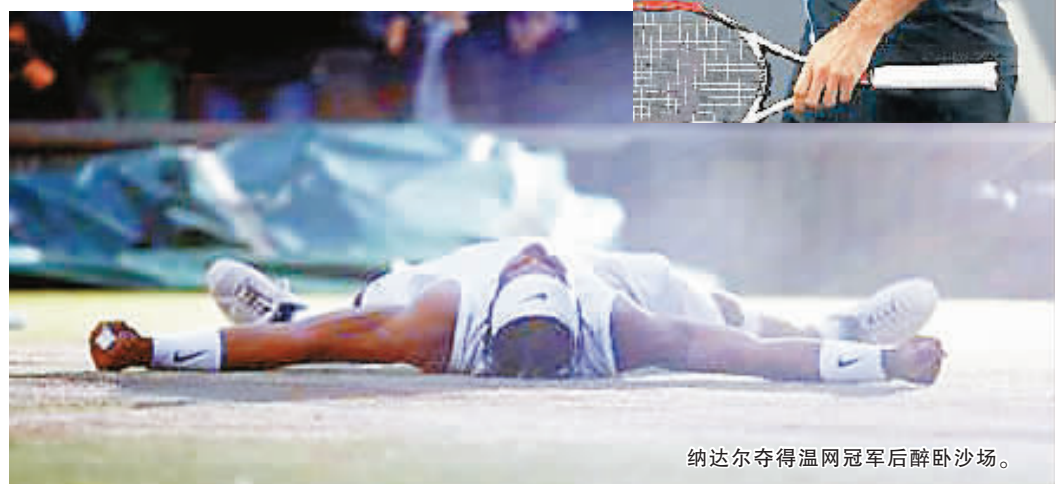
纳达尔夺得温网冠军后醉卧沙场。