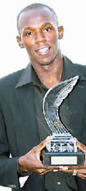
博尔特又领取一座奖杯。