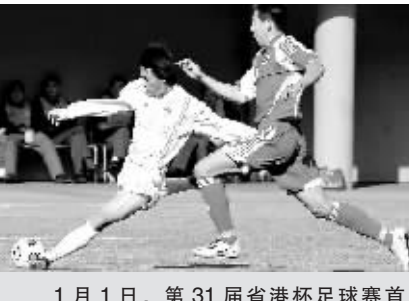
1月1日,第31届香港杯足球赛首回合比赛在广州举行,广东队以3比1战胜香港队。

中国足协规定的2009中超足球俱乐部集训日期为1月30日至2月26日,集训地为昆明海埂基,2月13日安排YOYO体能测试。