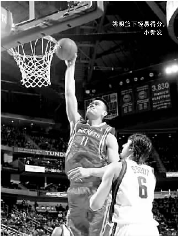
姚明篮下轻易得分。 小新发

谈到未来,庞伟更希望大家多关注他们在来年的第一场比赛——4月初的射击世界杯韩国站,10月的全运会,2010年的亚运会,2012年伦敦奥运会的表现……“我们的共同目标就是拿冠军,会为了这个目标不断努力的。”庞伟坦言道。(何震)