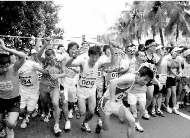
2009新年第一天,1100名马拉松爱好者汇聚在海口市万绿园门前,海口2009“统一绿茶杯”马拉松公开赛在这里发枪起跑。此次比赛由海口马拉松俱乐部主办。图为发令枪响,选手起跑。