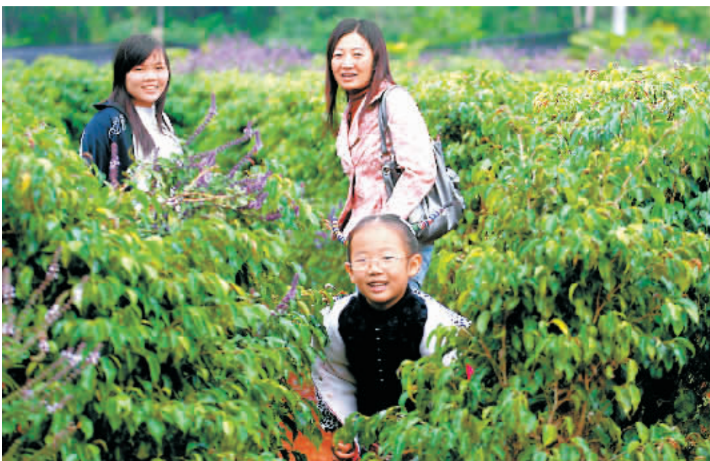
乡游 1月2日,在距海口市30公里的三江镇凤生香草园,不少市民来这里体验农家乐趣。