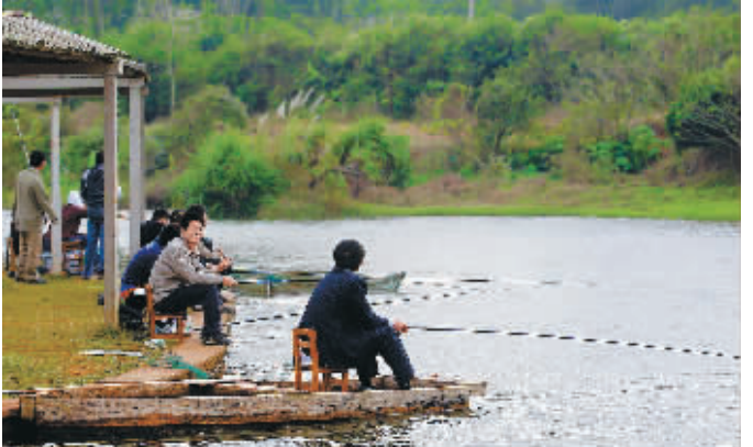
垂钓 1月2日,在海口市郊的一个休闲农庄内,游客正在休闲垂钓。