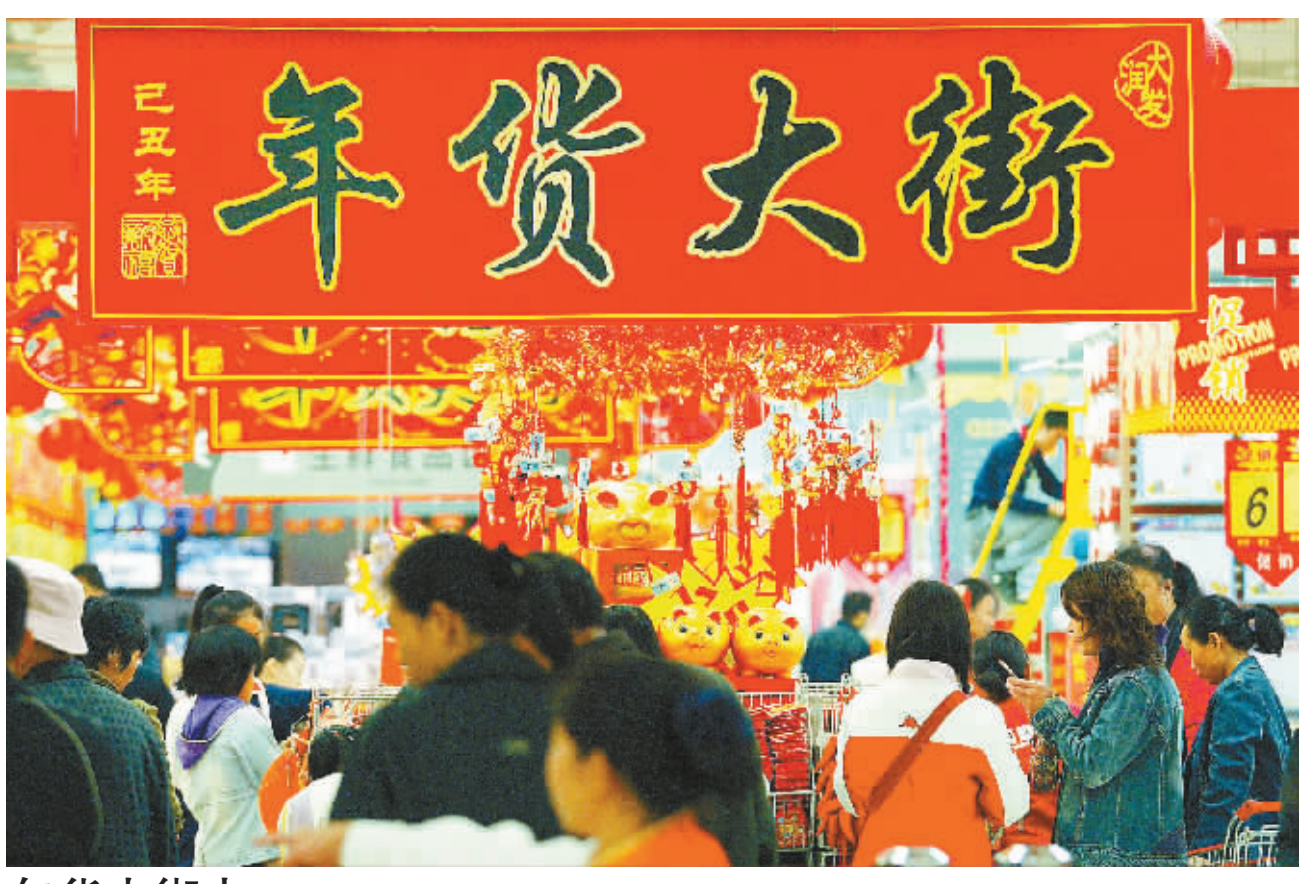
年货大街火 海口年货市场上一片红火。

在国贸一家贸易公司工作的王先生说,最近充斥耳都是全球金融危机,未来的日子还不知道是怎样的。“能省的尽量省吧。”王先生说。元旦这天,王先生一家人先是逛了新华南路的电器城,再去附近的人民公园游玩。“这个元旦一分钱都没有花,但是看看那么多款式新颖的电器也是一种节日的享受啊。” 在海南大学工作的陈女士,1日上午约了几位朋友带着各自的小孩到国贸宜欣广场电玩城玩,再接着到超市购物。“花钱不多又把自己需要的东西购齐,过这样的节日很经济实惠。”她开心地说道。 (本报海口1月3日讯)