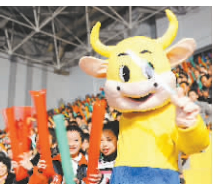
“牛”气冲天 牛年未到,“牛”气已冲天。