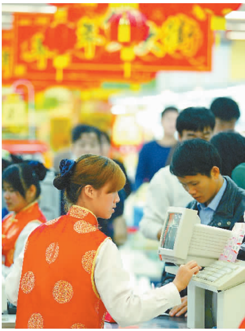
街上人如潮 海口市解放西路上,购物、出行的人挤满街头。