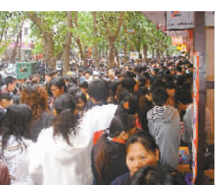
街上人如潮 海口市解放西路上,购物、出行的人挤满街头。