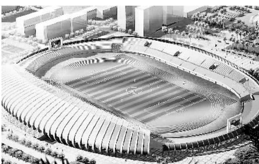
三亚市体育中心效果图。 本报记者 程范滢 翻拍

这也促使三亚再想新的对策。2006年,三亚一些职能部门负责人到北京等地学习奥运场馆的建造经验,发现奥运场馆大都建在高校内,这样利于运营维护。因此提出建议:为了更加合理配置文化体育产业资源,实现政府投资效益最大化,将体育中心的功能剥离出来,择址另建。