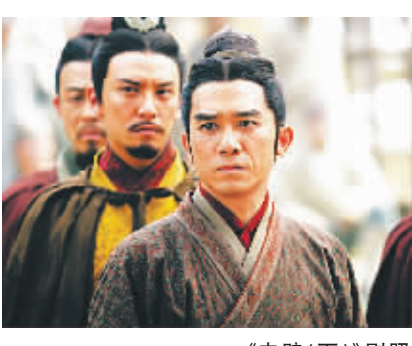
《赤壁(下)》剧照 新华社北京1月8日电 (记者白薇)记者8日从发行方中影集团获悉,由吴宇森导演的影片《赤壁(下)》7日下午点映后,10个小时内获得1500万元票房。

电影《赤壁(上)》曾以史无前例3.2亿元将华语电影票房推向一个全新的高度。《赤壁(下)》7日下午起在北京、上海、广州、武汉、重庆等大城市点映,8日起在全国上映。