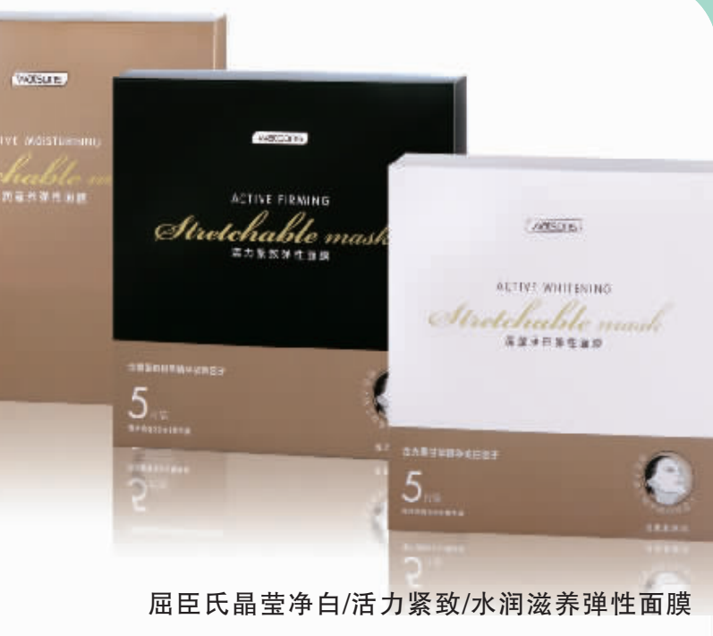
屈臣氏晶莹净白/活力紧致/水润滋养弹性面膜

什么是SOD: 中文名“超氧歧化酶”,它是阻止衰老的防火墙,在现代生活中,环境污染、各种辐射以及运动过量,都会造成“氧自由基”的大量形成,氧自由基直接损害人体细胞,加速衰老。SOD可对抗氧自由基对皮肤造成的损害,并及时修复衰老肌肤,增强肌肤弹性,具有与SOD相似的功效。 什么是EGF: 表皮生长因子,被誉为“美容基因”。它直接刺激细胞分裂、再生、组织重建,能活化衰老皮肤的细胞,使皮肤变得光滑而有弹性。研究表明,燕窝提取物中蕴含EGF,是美容珍品。详情请登陆屈臣氏网页 www.watsons.com.cn