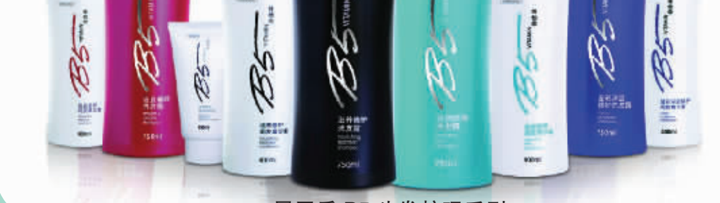
屈臣氏B5头发护理系列