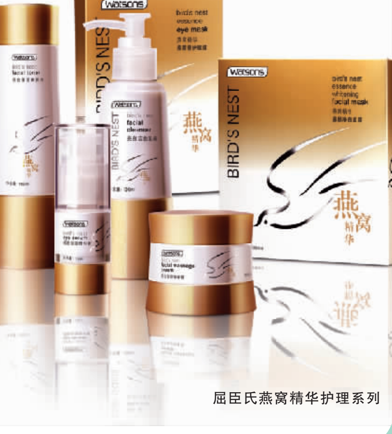
屈臣氏燕窝精华护理系列