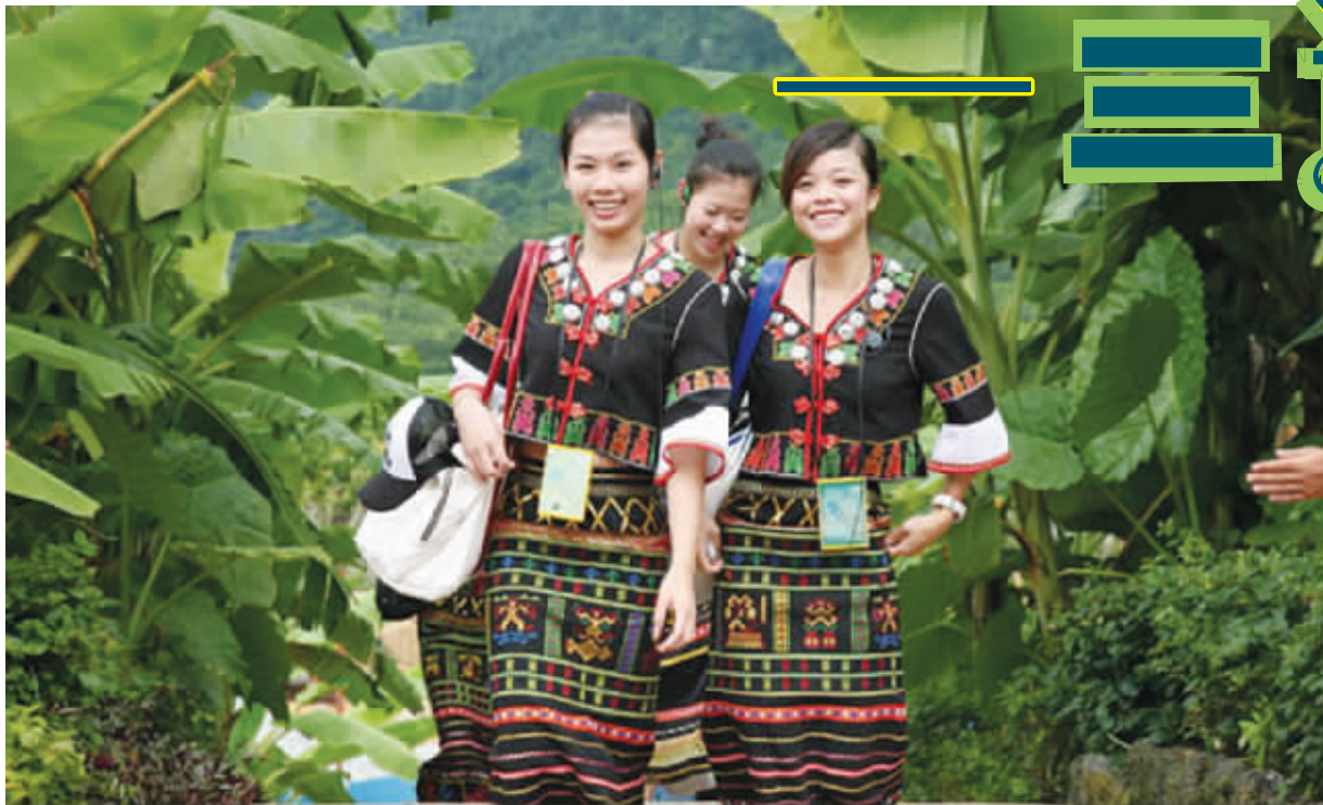
保亭仙女嬉游雨林

三道镇位于保亭县西南部，距县城31公里，东南与三亚市交界，西南邻南林乡，西北连新政镇，东北依加茂镇，海榆中线贯穿镇境南北，素有保亭“南大门”和绿色看保亭的前沿之称。三道镇辖区内有二个风景旅游区：保亭第一湾——“呀喏哒”雨林文化旅游景区和省最大的黎苗风情景区——槟榔谷；三道镇有中国唯一的两个万亩红毛丹基地；三道镇有原汁原味的黎苗民族文化，有美妙绝伦的原生态民歌。