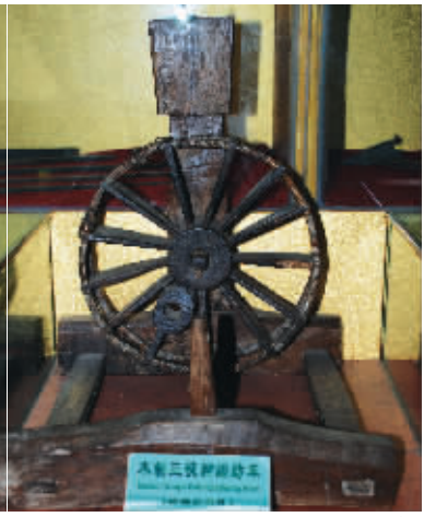
木制三锭脚踏纺车