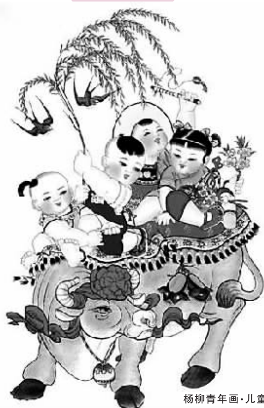
杨柳青年画·儿童嬉牛