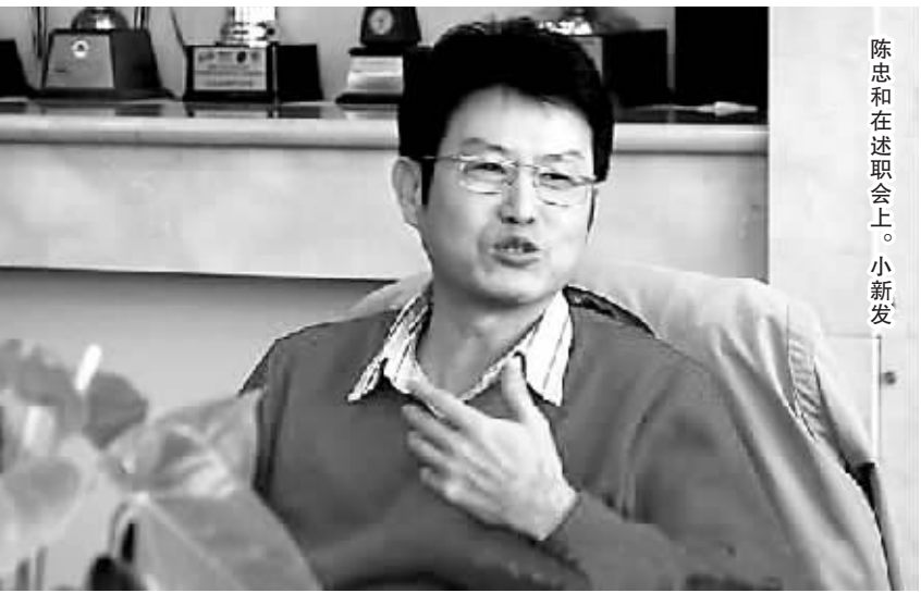
陈忠和在述职会上。小新发

表示,自己仍有一股干劲和对排球的热爱,他表达了希望能够连任中国女排主教练的愿望。 在今天的中国排管中心述职会议上,陈忠和被安排在下午2点进行述职。当陈忠和提前十分钟到达会场时,人们看到的是一直微笑着、身着一身大红毛衣的陈忠和。据了解,陈忠和在述职报告