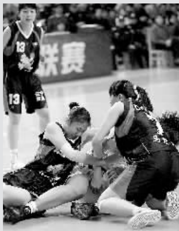
比赛中,八一广博队主场 77:70 战胜辽宁衡业队,将总比分扳成 1:2。图为双方球员倒地争球。

76人 99:100 凯尔特人 骑士 101:83 猛龙 步行者 111:116 森林狼 网队 99:85 雄鹿 火箭 107:100 公牛 掘金 104:96 马刺