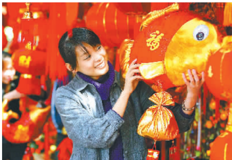
一系列刺激需求和振兴经济的计划，对稳定市场价格起到了积极作用。本报记者 古月 摄

两项重大举措将对消费产生积极作用，一个是医改，现在正在完善，准备出台；另外一个教改，正在征求意见。如果这两项重要措施出台，对中国的消费市场，特别是农村消费将产生积极效果。