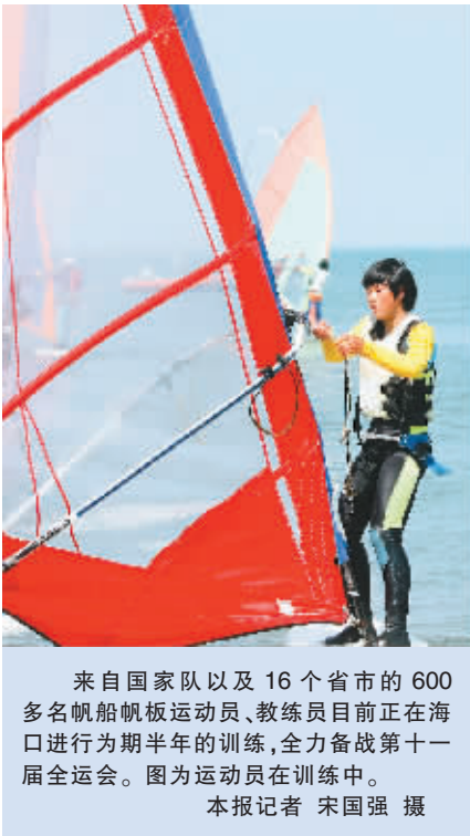
来自国家队以及16个省市的600多名帆船帆板运动员、教练员目前正在海口进行为期半年的训练,全力备战第十一届全运会。图为运动员在训练中。

新华社基辅2月15日电 俄罗斯女子撑杆跳高奥运冠军伊辛巴耶娃15日在乌克兰举行的一项年度大赛中再次刷新室内世界纪录,将横杆的位置提升到5米的高度。 伊辛巴耶娃之前的纪录为4米95,她六次参加这项在顿涅茨克举行的大赛,年年都奉献新的世界纪录。 比赛中,26岁的伊辛巴耶娃在4米86这个高度上确保冠军,将后面的比赛变成了破纪录的“个人表演”,她两次挑战4米96未果,第三次却要了4米97。 “完全是因为迷信,我觉得4米96不吉利,索性要了4米97。”这位两届奥运会冠军说。 果然,她顺利地越过这个高度,创造了新的世界纪录,又意犹未尽地挑战5米的高度,并在第二跳时成功。