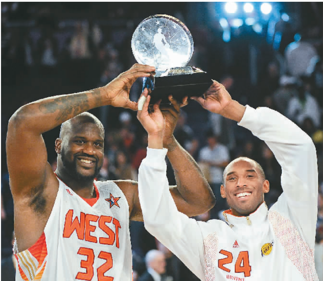
科比(右)与奥尼尔一同捧起全明星赛最有价值球员奖杯。

奥尼尔谈全明星赛——这可能我最后一届 本报讯 北京时间16日上午,第58届NBA全明星比赛在美国凤凰城举行。结果西部明星队以146:119战胜东部明星队。科比得到27分,奥尼尔得到17分,OK组合上演和谐一幕,二人联手得到本届全明星赛事的MVP。 比赛进行到第四节时,奥尼尔在接受记者场边采访时说:“我必须对得起我的哥们儿,也就是科比,今天就好像是时间倒流到了1999年到2002年之间,每当我感到想偷懒时,科比就会说,‘嘿,哥们儿,加油。’我们的友谊从未间断,我们一直相互尊重。我们都拥有可爱的女儿,每次我们见面都充满了温情。” 赛后,斯特恩把MVP奖杯发给奥尼尔和科比,主持人厄尔尼对OK组合进行了现场采访。 厄尔尼:你现在有什么感想? 奥尼尔:我很高兴能出现在这里,这可能我最后一次全明星赛事了,我已经37岁了,我很高兴教练们能够为我投票。我也很感谢科比能够在场上为我传球,并且其他球员也是如此。我很感激他们,我很高兴能够得到这个奖杯。 厄尔尼:沙克,今天你从头到尾都让比赛充满了娱乐性,赛前你跳舞出场的这些想法从何而来?