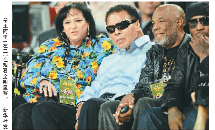
拳王阿里(左二)在观看全明星赛。

姚明自嘲——打全明星是凑热闹 本报讯 西部明星队北京时间16日在2009年全明星赛以146:119大胜东部明星队,姚明第七次参加全明星赛,上场12分钟,拿下2分3个篮板。 姚明在混合采访区,接受了媒体的采访,谈到了第七次全明星之旅。 “今天比赛打得有点轻松,通常第四节会有竞争,今天第三节领先20来分了,第四节是表演时间了,詹姆斯扣篮,科比都一对一,也不能忘了沙克,他总是星光璀璨。”姚明说。 对于姚明来说,每次全明星,感觉相同也不同。“有一场比赛,得到放松,享受比赛,看比赛,可以打一点点比赛,这是不同的经验。”姚明说,“又看到科比和沙克一个队,感觉很不一样。见到很多老朋友,认识很多新朋友,参与很多的晚会,也看到了精彩的比赛。打全明星,我是来凑凑热闹的。” “每年节目都很好看。”姚明意味深长地说,年年参加全明星赛,但这并不是他所擅长的舞台。 不过,他现在更关心火箭。“大家提了很多关于火箭的问题,这证明很多人关心我们,关注我们,很显然我们还有29场比赛,我们必须冲一下了,冲击季后赛了。”(阿义)