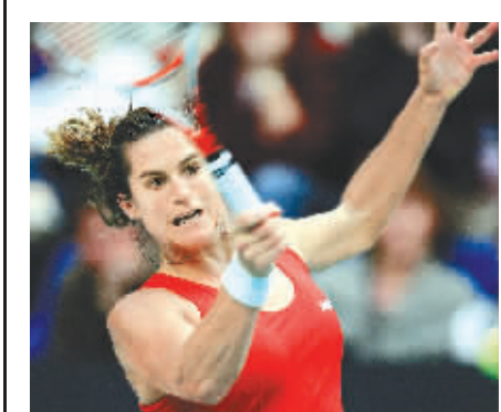
莫雷斯莫在巴黎网球公开赛决赛中。

据新华社布鲁塞尔2月15日电 (记者谢栋风)世界排名第四的英国网球新锐穆雷15日下午以2:1击败右膝受伤的世界头号球手、“西班牙小子”纳达尔,在总奖金144万欧元的荷兰鹿特丹网球赛上成功夺冠,同时延续了自去年美国网球公开赛以来对纳达尔的全胜战绩。 尽管纳达尔今年刚刚夺得澳大利亚公开赛冠军,而且之前在正式比赛中对穆雷拥有5胜1负的绝对优势;但穆雷赢得了两人最近一次交锋,也就是美国公开赛半决赛的胜利。此外,在年初于阿联酋迪拜举行的表演赛中,穆雷也击败了纳达尔。应该说,穆雷并不忌惮纳达尔。 比赛的第一盘,双方发挥都较为正常。穆雷抓住纳达尔送出的仅有的两次破发机会中的一次,以6:3先下一城。纳达尔在第二盘开始仅3分钟时不慎右膝受伤,经过简单治疗后继续上场比赛;随后双方展开了破发大战,纳达尔四破穆雷的发球局,穆雷也三破纳达尔的发球局,纳达尔艰难地以6:4扳回一盘。进入决胜盘,纳达尔的伤情越来越严重,穆雷完全掌控了局面,三破纳达尔的发球局,以6:0出人意料轻松赢得了最终的胜利。 这也是这位英国选手首次赢得有36年历史的本国赛事的男单冠军。穆雷不仅获得27.7万欧元的巨额奖金,而且还赢得500分的世界排名积分。亚军纳达尔获得12.5万欧元的奖金和300分的积分。