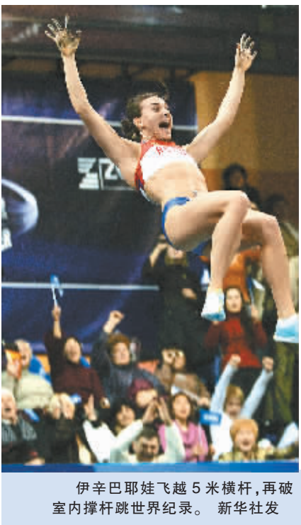
伊辛巴耶娃飞跃5米横杆,再破室内撑杆跳世界纪录。

新华社伦敦2月15日电 据英国《金融时报》网站报道,申办2016年夏季奥运会的四个城市近日公布了它们厉行节约的预算。在全球经济危机影响日益严重之际,奉行节俭已成为目前奥运申办的主流意识。 东京、马德里、里约热内卢和芝加哥这四个申办城市今年10月将在哥本哈根获悉国际奥委会的决定。13日,这几个城市发布了节约成本的申办计划,希望借此让国际奥委会的100多名委员相信,它们的相关支出是理智而谨慎的。 东京在这方面起到了带头作用,这个城市44亿美元的基础设施预算和奥运会基金已经相当节俭,而且大部分已经到位。当地政府自2006年以来一直在为举办奥运会筹措资金。 东京奥申委主席河野一郎说:“我们只有5座场馆需要新建,至于我们的预算,我认为不会增长,国际奥委会的许多委员都希望(申办城市)有非常稳定的财政状况。” 马德里方面则表示,该市提出的25亿美元的基础设施预算是“奥运会历史上资金最少的预算之一”,因为马德里77%的体育场馆都已经建成或正在施工。 国际奥委会前主席萨马兰奇之子、西班牙的国际奥委会委员胡安·安东尼奥·萨马兰奇说:“马德里的情况能够做到完全确定,申办奥运会不会危及人们的生活,这是非常重要的。” 里约热内卢的申办难度似乎要大一些,因为它打算花费102亿美元来为举办奥运会修建相关设施,尽管奥运会专用场馆只占三分之一。 芝加哥一直向市民承诺,举办奥运会的83亿美元支出将完全由私人赞助负担。 目睹了2012年伦敦奥运会筹备工作遭遇的混乱之后,对于国际奥委会委员来说,这种承诺可能无法打动他们。 四年前伦敦详细的申办计划,与它后来公布的实际预算相差甚远,这一点令国际奥委会的委员们记忆犹新。