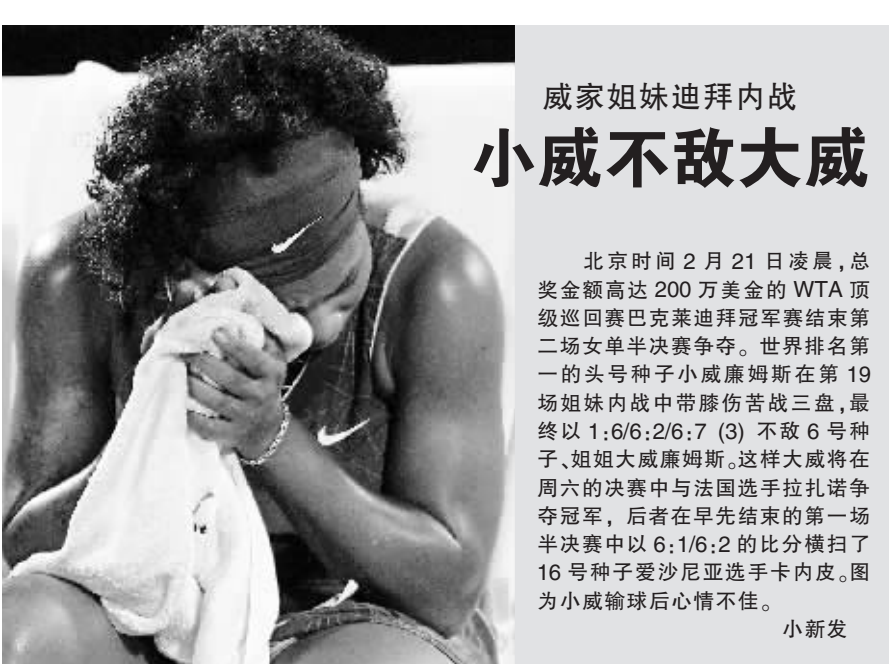
北京时间 2 月 21 日凌晨，总奖金高达 200 万美金的 WTA 顶级巡回赛巴库莱迪拜冠军赛结束第二场女单半决赛争夺。世界排名第一的头号种子小威廉姆斯在第 19 场姐妹内战中带伤苦战三盘，最终以 1:6/6:2/6:7 (3) 不敌 6 号种子、姐姐大威廉姆斯。这样大威将在周六的决赛中同法国选手拉扎诺争夺冠军，后者在早先结束的第一场半决赛中以 6:1/6:2 的比分横扫了 16 号种子爱沙尼亚选手卡内皮。图为小威输球后心情不佳。